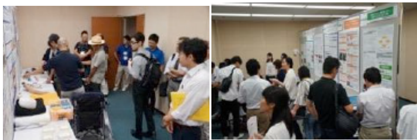
インタラクティブ