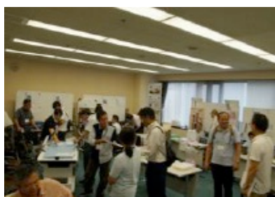
福祉機器コンテスト一次通過作品展示