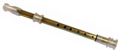
機器開発部門「スライドリコーダー」